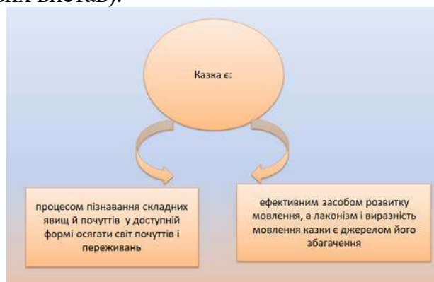
Рис. 1. Значення казки для розвитку дитини

Творчий розвиток: уява (казки розвивають дитячу уяву; фантастичні казки є прикладами найкращого оповідання історій, а прості, але таємничі сюжети не тільки розважають, але й є одними з найкращих інструментів для навчання історії дітям), різноманітність (незважаючи на те, що ми розглядаємо казки як окрему категорію, ви знайдете історії, які є глибокодумними, романтичними або навіть орієнтованими на дії, а це означає, що для кожного знайдеться щось цікаве), культура (події в цих казках відбуваються у різних частинах світу, і під час читання вони тонко відкривають дітям багато культур), зв'язок поколінь (казки можуть подолати прірву між поколіннями між дітьми та їхніми бабусями і дідусями, забезпечуючи спільні історії, з якими вони можуть спілкуватися), драматичний вплив (казки є одним із найкращих джерел для ролевих ігор, ігор або дитячих лялькових вистав).