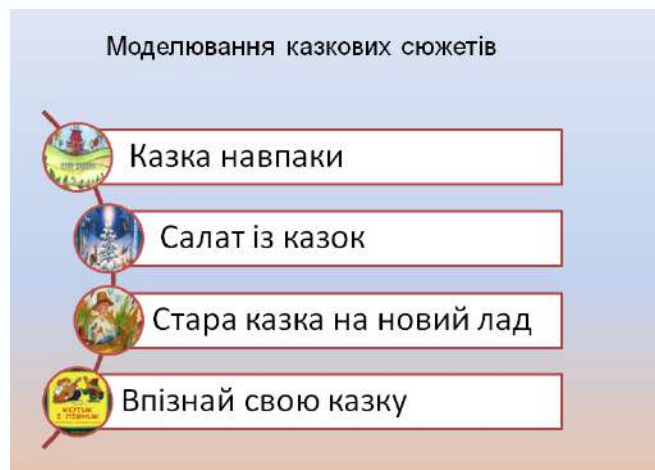
Рис. 4. Форми казкотворчої роботи з дітьми

Моральне виховання: відсутність сірого (ці історії прості; вони чорно-білі; вони демонструють добро проти зла та навчають дітей правильного від поганого (через підтекст) у спосіб, який надзвичайно легко побачити. Слухаючи ці казки, визначають головного героя і хочуть бути героєм, а не лиходієм), відблиски Євангелія (казки навчають урокам (любові, честі, жертвності, надії, мужності, наполегливості та справедливості) та, дозволяють дітям краще зрозуміти ці поняття через історію).