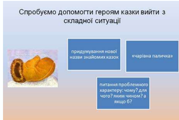
Рис. 3. Форми казкотворчої роботи з дітьми

конфлікт, який сприяє зміцненню психіки. Класичний щасливий кінець екзистенційної проблеми історії теж не зашкодить).