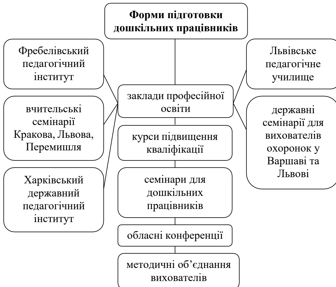
Рис. 2. Фахова підготовка вихователів дошкільних інституцій Волині (перша половина ХХ ст.)

У першій половині ХХ ст. в краї склалися різноманітні форми фахової підготовки працівників дошкільних закладів, представлені на рис. 2.